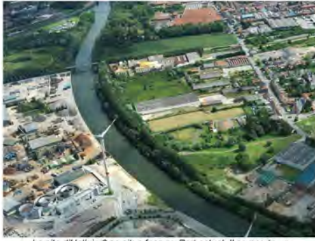
Le site d'Halluin 3 se situe face au Port actuel. Il comporte un bâtiment qui s'avance presque jusqu'à la rive, au centre de la photo.

La localisation d'un nouveau port sur le secteur d'Halluin vise à tirer parti de la position stratégique de cette zone par rapport à la Métropole Lilloise. Il s'agit en effet de la porte d'entrée de cette métropole (1,1 million d'habitants) par le nord. La traversée de cette agglomération dense peut poser quelques difficultés, y compris pour le trafic fluvial (présence de quelques ponts qu'il sera difficile de relever au-delà des 5,25 mètres actuels de tirant d'air). Dans ces conditions, il peut s'avérer judicieux de se servir d'Halluin comme point de déchargement pour des produits destinés à la Métropole Lilloise mais voulant échapper à ces difficultés. Ça pourrait notamment être le cas pour des trafics intermodaux. Ce site d'Halluin 3 permettrait à Halluin de se positionner sur tout type de produits, quel que soit le conditionnement : vrac, conteneur, conventionnel.